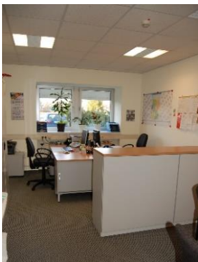
Тут Ви отримаєте пораду Hier werden Sie beraten