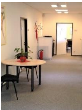
Тут Вас зустрінуть Hier werden Sie freundlich empfangen