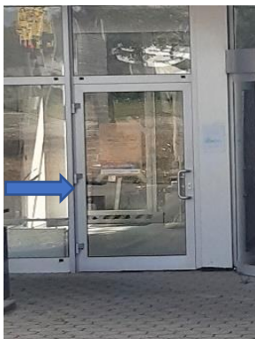
Ось так до нас йти Hier geht es zu uns