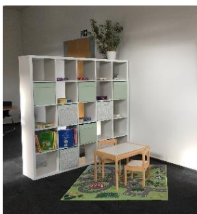
зі своїми дітьми Unsere Kinderecke