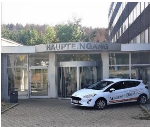
Тут Вам допоможуть Hier wird Ihnen geholfen